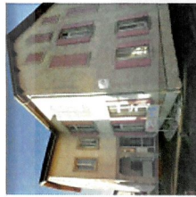
(face à l'OPH)